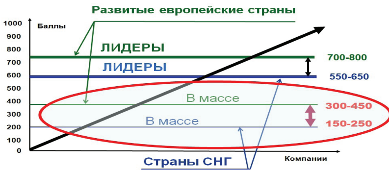
Рис. 2. Шкала и уровни организационного (делового совершенства)

ного, долговременного, последовательного и системного совершенствования любых организаций в регионе ЦВЕ.